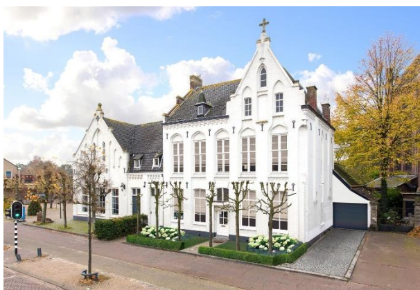
(Voormalig klooster Ulvenhout)

De rit gaat verder en door mooie binnendoor wegen gaan we richting de westelijke kant van Brabant en passeren de plaatsjes Chaam , Bavel en laten we met recht Breda links liggen. Wij komen aan in Ulvenhout en de eerste schriftelijke verwijzing naar Ulvenhout stamt uit 1274, waarin gesproken wordt over Ulvenholti. Latere vermeldingen komen uit 1277 (Ulvenhout), 1308 (Olvenhout) en 1328 (Hulvenhout).